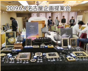
2019.6.4名古屋企画提案会