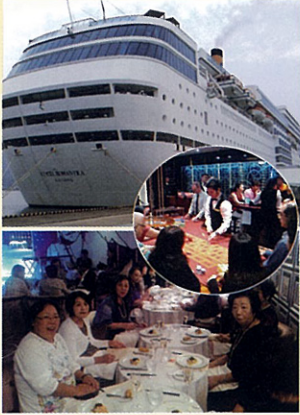
H29.10.18・19 瑞宝会福岡会場