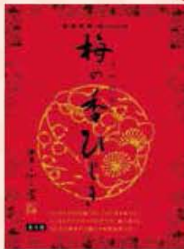
ふく富「梅の香ひじき」

博多土産の横綱は、辛子明太子に疑う余地なしですがここ数年、台頭してきているのが「梅の香ひじき」。ひじきに、梅肉(カリカリ梅)とゴマを和えた半生タイプのふりかけです。主な発売元は2社あり、 マツコデラックス おすすめの 十二堂えとや「梅の実ひじき」 と、 メディア 露出