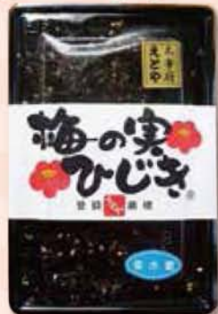
十二堂えとや「梅の実ひじき」