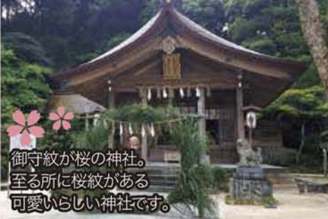
御守紋が桜の神社。至る所に桜紋がある可愛い神社です。